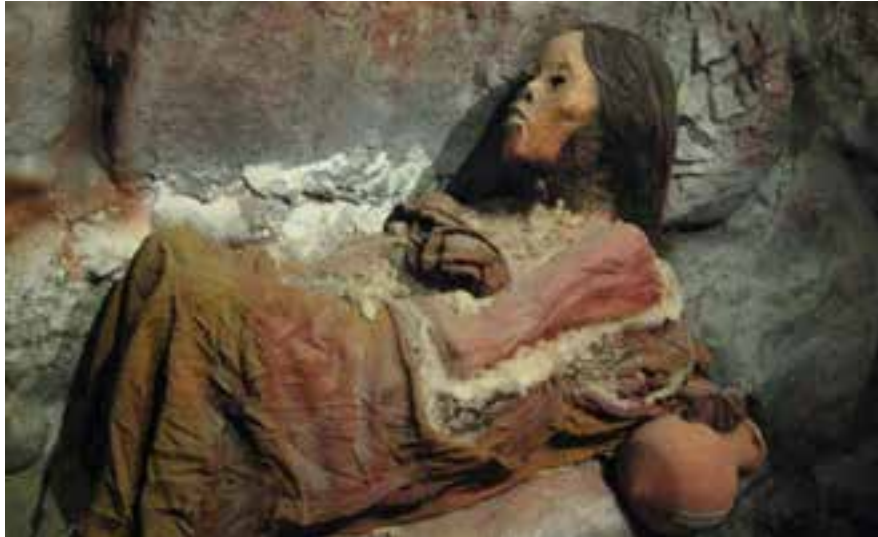
La Dama del Nevado Ampato, Arequipa - Perú

Durante una expedición al nevado Ampato en 1995 se descubrió el cuerpo momificado de esta joven, excelentemente conservada en la nieve. Además, en los alrededores se encontraron múltiples ofrendas como estatuillas de oro, spondyllus, y diferentes tipos de plantas.