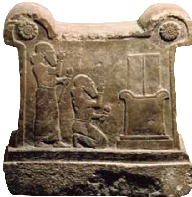
Altar del templo de Ishtar en Assur mostrando Toukoulti-Ninurta I en adoración ante el símbolo del Dios Nusku Vorderasiatisches Museo de Berlín

al Ara y lo saludamos, no sólo estamos dando una muestra de respeto al símbolo en cuestión y a todo aquello que llevamos dicho acerca de lo que él representa, sino que además renovamos ritualmente nuestros compromisos y promesas masónicas, volviendo a religarnos con ellas, precisamente en el lugar de la recepción de las emanaciones del G.º. A.º. D.º. U.º., lo cual constituye un perenne recordatorio de nuestra auténtica calidad masónica. ■