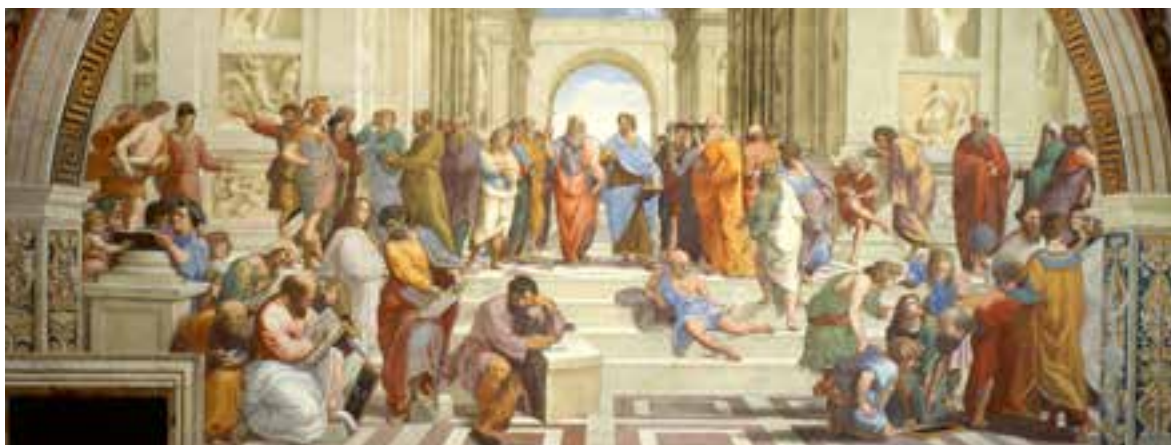
La escuela de Atenas, pintura del artista Rafael Sanzio.