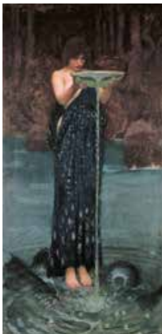
Circe envidiosa. Pintura de John William Waterhouse Art Gallery South Australia

de elegir el bien o el mal y asumir sus consecuencias. Un Dios paternalista y sobreprotector flotando sobre los fieles puede ser muy consoladora, pero no se condice en para nada con la realidad de un Dios Cósmico.