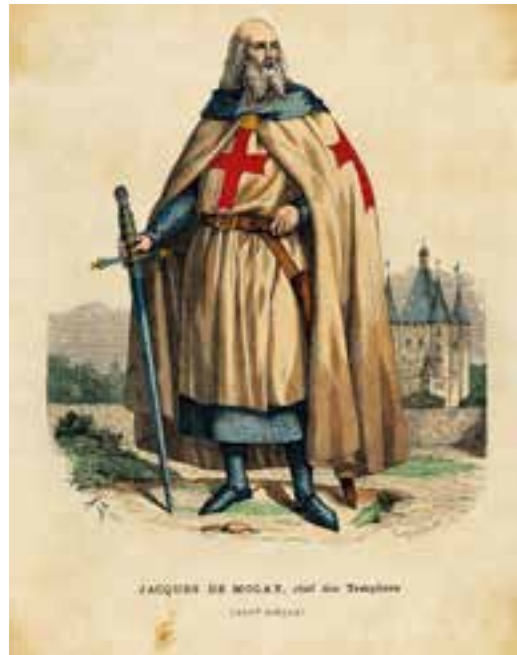
Grabado que data del siglo XIX representando a Jacques de Molay, último Gran Maestre de la Orden del Templo o de los Caballeros Templarios. La Torre del Temple, en París, es representada en el paisaje del fondo.

Desde entonces, la organización se ha extendido a muchos otros países alrededor del mundo, siendo reconocidos oficialmente además de los EE.UU., en Alemania, Aruba, Australia, Bolivia, Brasil, Canadá, Filipinas, Francia, Italia, Japón, Paraguay, Perú, Rumania, Serbia, Uruguay, entre otros. ■