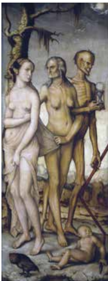
La tres edades del Hombre, obra del pintor alemán renacentista Hans Baldung.