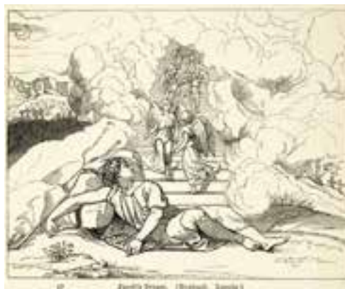
Esbozo de El Sueño de Jacob por Raffaello Sanzio

No se puede comprobar la existencia del mundo espiritual por medio de experimentos tecnológicos modernos. La meditación, el estado místico y la entrega fervorosa como la apertura de los trabajos, es el medio para comunicarnos con ellos.