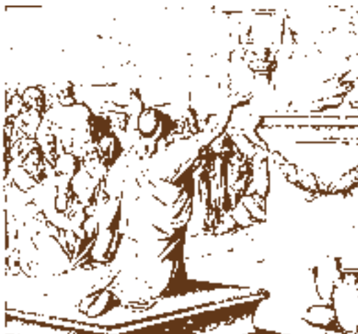
El Rey Salomón dedica el Templo (Ilustración del 1890).

"Luego se puso Salomón delante del altar de Jehová, en presencia de toda la congregación de Israel, y extendiendo sus manos al cielo:" 1 Reyes 8:22 RV