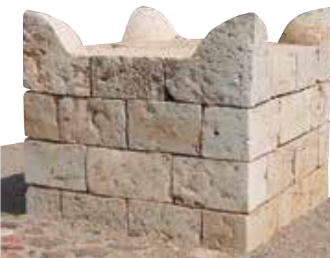
Beerseba - Israel, Altar de los Cuatro Cuernos.

El Altar de Ofra, levantado por Gedeón (Jueces 6:24) resultó de la ayuda de “seres de luz”. Algunos lugares santos cuya existencia se remonta a tiempos anteriores a la conquista israelita, siguen siendo visitados, como es el caso del Santuario de Gabaón que fue visitado